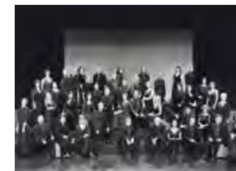
Chor des Bayerischen Rundfunks