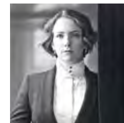
Alondra de la Parra